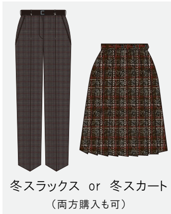
冬スラックス or 冬スカート (両方購入も可)