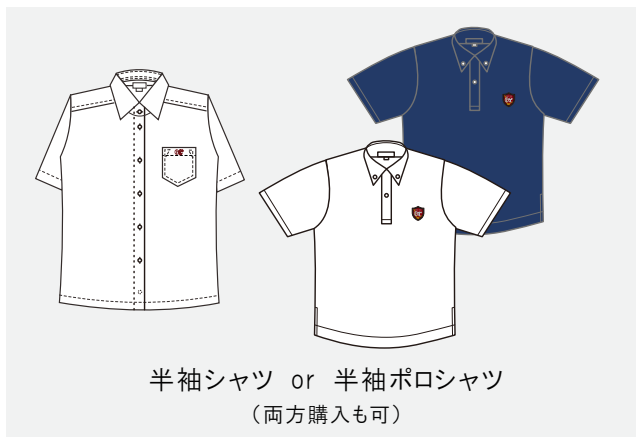
半袖シャツ or 半袖ポロシャツ (両方購入も可)