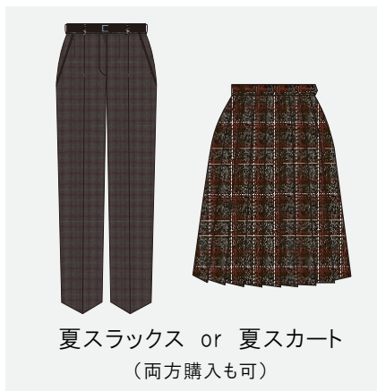
夏スラックス or 夏スカート (両方購入も可)