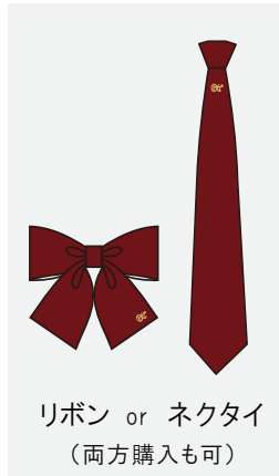
リボン or ネクタイ (両方購入も可)